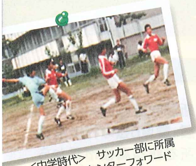
<中学時代> サッカー部に所属 ポジションはセンターフォワード