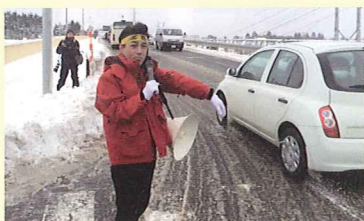
当選翌朝の辻立ち

上記の2要素は次の選挙ではありません。だからこそ当選の瞬間に勝利は忘れ、次回の戦いがその瞬間から始まったと自覚しております。翌朝からいつもの雪の中での辻立ち、あいさつ回り、新年の初詣挨拶と地道