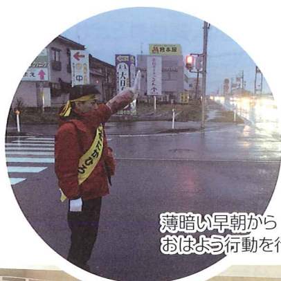
薄暗い早朝からおはよう行動を行う