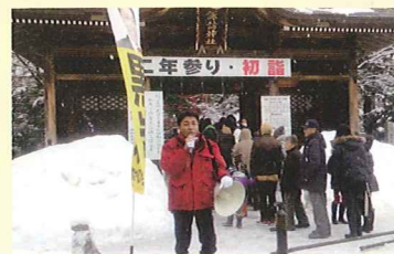
諏訪神社前に年頭挨拶

「34票差」の悔しさは一生忘れる事はありません。この想いを胸に秘め命がけで仕事をして参りますし、皆様にも「34票差」を忘れる事なくご支援頂きます様よろしくお願い申し上げます。