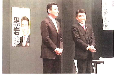
前原誠司元外務大臣応援に