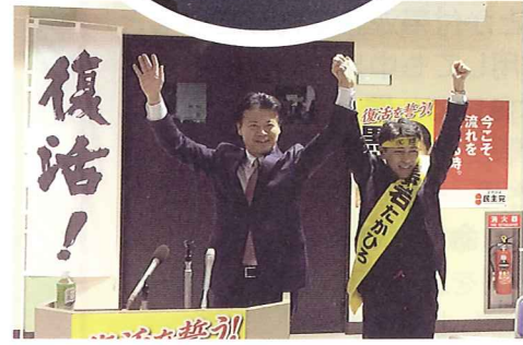
新発田集会 玄葉元外務大臣応援に