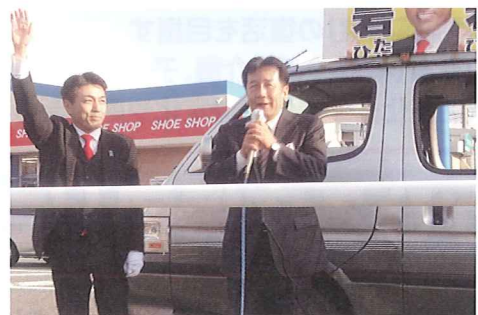
枝野幸男幹事長応援に