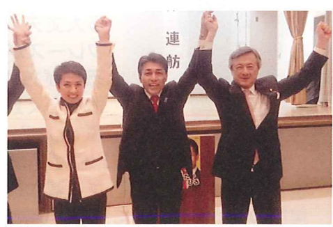
阿賀野市集会 連舫・白参議員、応援に