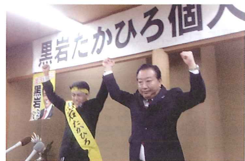
野田佳彦前総理応援に